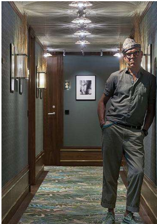
Personalidad. Erhland crea espacios únicos mezclando materiales, técnicas y estilos.

Busco lo perfecto; jugar con lo reconocible poniéndolo en nuevos contextos, desafiando lo convencional; y mezclar materiales, texturas, superficies, métodos de trabajo, estilos, colores y proporciones, pero que todo se vea natural.