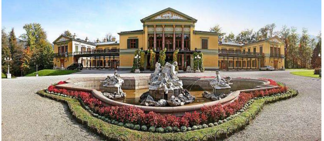
El archiduque Francisco Carlos y Sofía de Baviera regalaron a su primogénito Francisco José I de Austria y a su esposa, Sissi, por su boda la Villa Imperial de Bad Ischl.