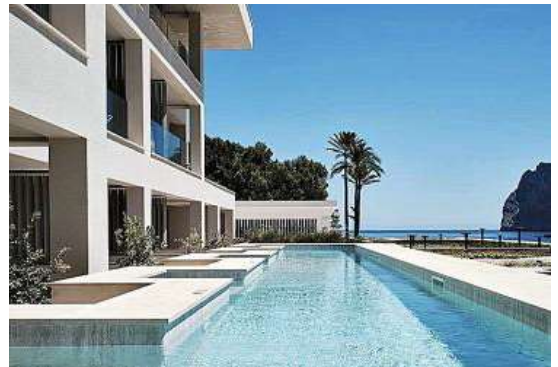
El diseño de El Llorenç Parc de la Mar y El Vicenç de la Mar se inspira en el Mediterráneo.

No sé si puedo decir que tenga un estilo; creo que cada trabajo debe ser único y para ello hay que aprovechar las oportunidades, características y cualidades que el proyecto ofrece y merece. Es posible encontrar un hilo conductor y una firma especial en mis proyectos en la forma en que mezclo sin miedo y libremente cosas